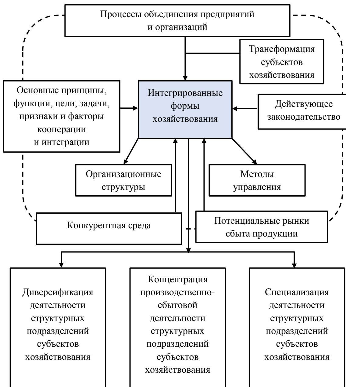
Рисунок 1 – Хозяйственный механизм развития кооперации и интеграции предприятий и организаций