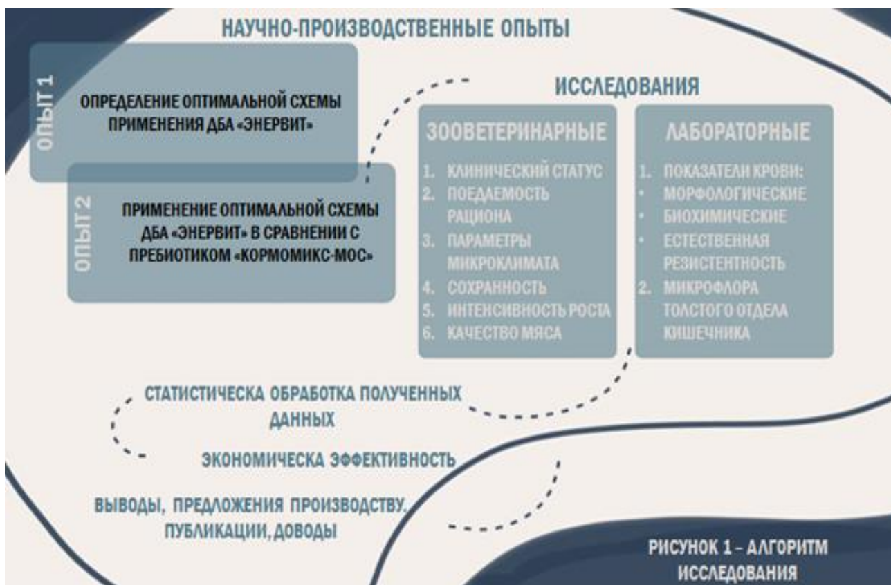
Рисунок 1 – Алгоритм исследования.

Алгоритм исследования представлен на рисунке 1.