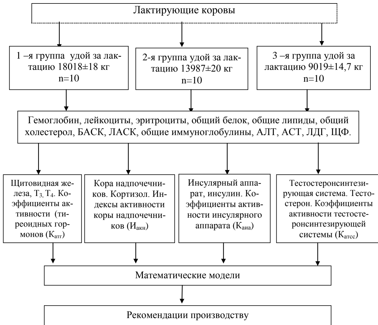
Рисунок 1 - Схема исследований

Диссертационная работа выполнялась на кафедре эпизоотологии, радиобиологии и фармакологии Курского ГАУ. Производственные опыты проводили на молочном комплексе ООО «ИНТЕРКРОС ЦЕНТР» Тульской области по следующей схеме (рисунок 1).