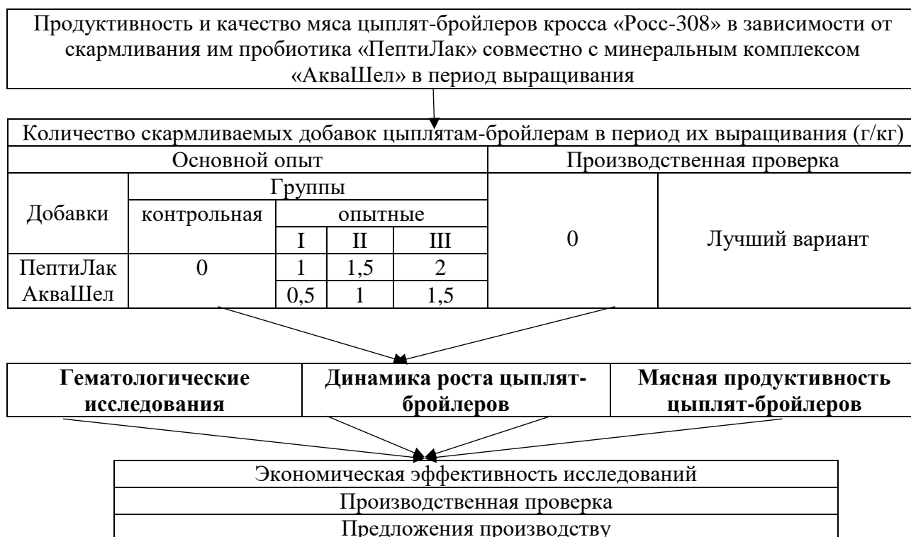
Рисунок 1 – Алгоритм проведения эксперимента

Алгоритм проведения опыта представлен на рисунке 1.